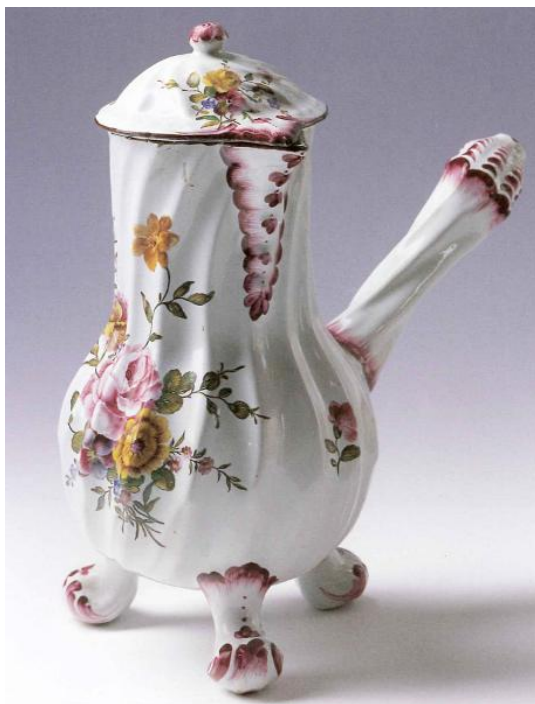
Cafetière Beromünster, vers 1775 Manufacture Andreas Dolder Faïence, décor peint en polychromie de petit feu Haut 24 cm Collection Musée national suisse

Une variante de cafetière, de forme comparable mais à la panse godronnée, est conservée au Musée national suisse (fig.1). On y retrouve les pieds rocaille, les éléments plastiques et la qualité du décor peint. La production de Beromünster est généralement marquée (c'est le cas pour notre cafetière) d'un "M" (pour Münster), suivi parfois des numéros 1, 2 ou 3 (fig. 2).